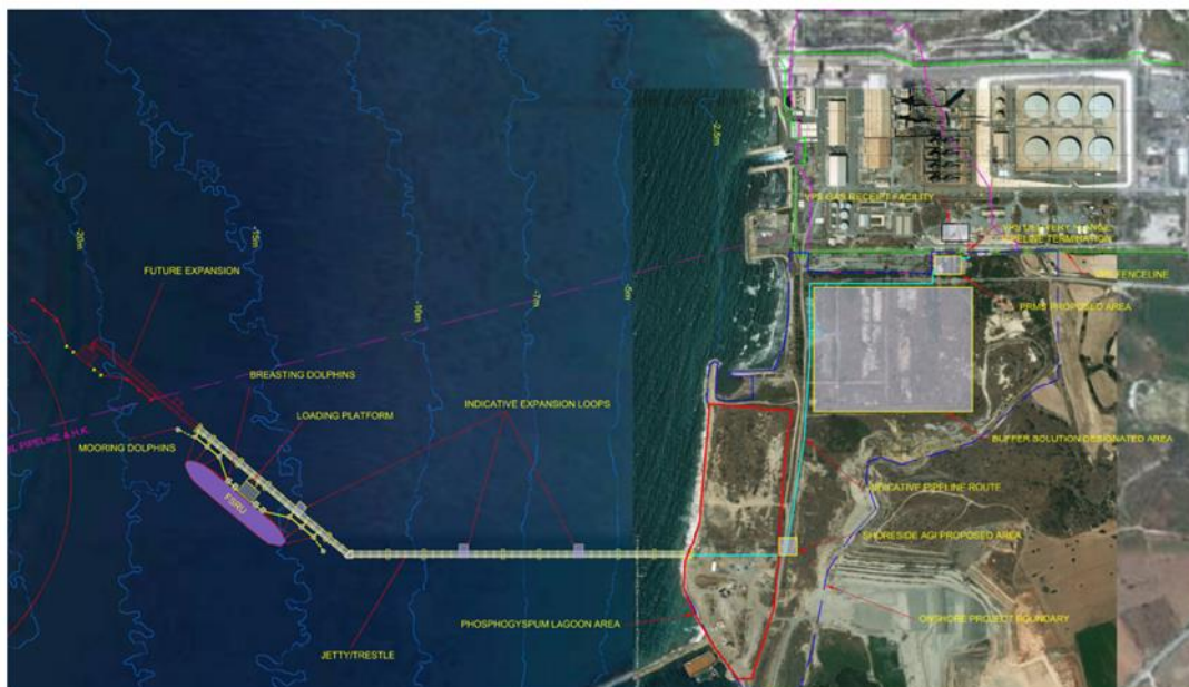
Διάγραμμα 2: Ενδεικτική Επισκόπηση έργου Τερματικού Εισαγωγής Υδροποιημένου Φυσικού Αερίου